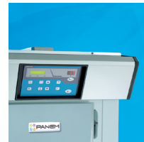
Façade de tableau inox Control board's front in stainless steel